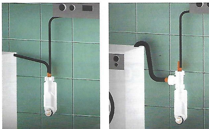
Fig. 2 - SPAZIO NT CLIMA dispone di un portagomma con doppio attacco

Con l'aggiunta di un TEE, già incluso nella confezione, il sifone può montare un attacco con diametro 20 – 25 divenendo così compatibile anche per gli scarichi di lavatrici e lavastoviglie (figura 2).