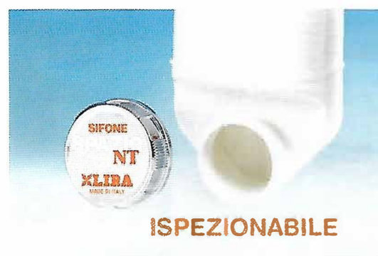
Fig. 4 - SPAZIO NT CLIMA è ispezionabile svitando il tappo di chiusura

Come tutti i sifoni della gamma NT, SPAZIO NT CLIMA è ispezionabile, nella parte anteriore consente, svitando il tappo di chiusura, di rimuovere gli eventuali residui accumulati nel sifone (figura 4).