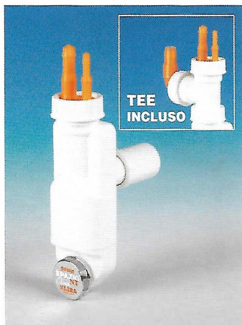
Fig. 1 - SPAZIO NT CLIMA è il nuovissimo sifone di LIRA

SPAZIO NT CLIMA è il nuovissimo sifone prodotto da LIRA , studiato per ricevere gli scarichi di apparecchiature che generano condensa (figura 1).